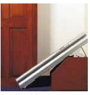
Миниватор 950 / 950+ ЛОСТУПНЫ С РУЧНЫМ СКЛАЛЫВАНИЕМ НАПРАВЛЯЮШЕЙ.

\Delta A9 TOFO, YTOBЫ СИДЕНЬЕ ОПУСТИЛОСЬ AOCTATO4HO НИЗКО РΛΔ ПОСАДКИ ЧТОБЫ ПОЛЬЗОВАТЕЛЯ. HEOEXOVINO ВЫХОЛИЛА НАПРАВЛЯЮШАЯ ЗА ПРЕЛЕЛЫ ЛЕСТНИЦЫ. НЕКОТОРЫЕ ДОМА ИМЕЮТ ДВЕРНОЙ ПРОЕМ БЛИЗКО К НИЖНЕЙ СТУПЕНЬКЕ И НАПРАВЛЯЮЩАЯ МОЖЕТ ПЕРЕКРЫТЬ ЭТОТ ПРОЕМ. В ЭТИХ УСЛОВИЯХ ДОЛЖНА БЫТЬ УСТАНОВЛЕНА СКЛАЛНАЯ НАПРАВЛЯЮШАЯ.