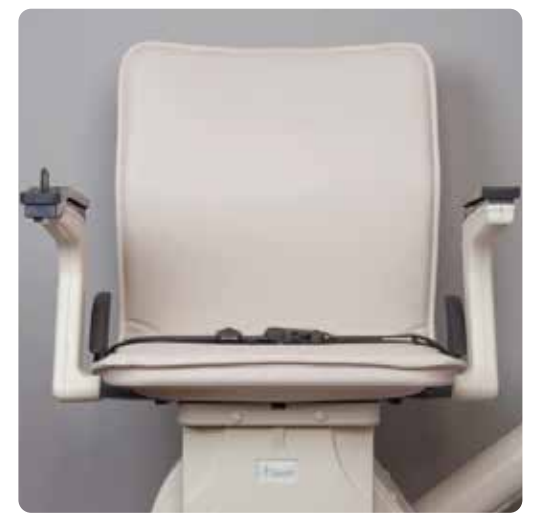
СТАНДАРТ Прекрасное соотношение ЭРГОНОМИКИ И КОМФОРТА ПРИ ПОСАДКЕ.

Мы предлагаем широкий выбор сидений для кресельных подъемников, для каждого из которых возможен выбор цвета (ИЗ 3-Х ВОЗМОЖНЫХ). НАЛИЧИЕ БОЛЬШОГО КОЛИЧЕСТВА ВАРИАНТОВ ПОЗВОЛЯЕТ ВЫБРАТЬ СИДЕНЬЕ МАКСИМАЛЬНО УДОБНОЕ ДЛЯ ВАС И В ТО ЖЕ ВРЕМЯ ПОДХОДЯЩЕЕ ПО СТИЛЮ К ДИЗАЙНУ ВАЩЕГО ДОМА. ПОТОМУ ЧТО УДОБСТВО ДОЛЖНО БЫТЬ КРАСИВЫМ!