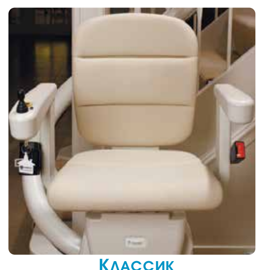
ЭРГОНОМИЧНЫЙ ДИЗАЙН СИДЕНИЙ СЕРИИ «КЛАССИК» ОБЕСПЕЧИВАЕТ НЕПРЕВЗОЙДЕННЫЙ КОМФОРТ, ТАК КАК ОНИ РАЗРАБАТЫВАЛИСЬ СОВМЕСНО С ПРАКТИКУЮЩИМИ врачами. Изготовлены из прочного, не скользкого ПОЛИУРЕТАНА. ПОВЕРХНОСТЬ НА ОЩУПЬ НАПОМИНАЕТ ТЕКСТУРИРОВАННУЮ КОЖУ. НАИБОЛЕЕ ВОСТРЕБОВАННАЯ СЕРИЯ СИДЕНИЙ.

Сидения серии «Элеганс» - это соче--ОННЯНРОТУ И АНЙАЕИД ОТОНИВНЕНО-ГО КОМФОРТА. ОБИВКА КРЕСЕЛ ВЫПОЛНЕ-НА ИЗ ОЧЕНЬ МЯГКОЙ ТКАНИ, ДАРЯШЕЙ ОШУШЕНИЕ РОСКОШИ ПРИ ПРИКОСНОВЕнии.